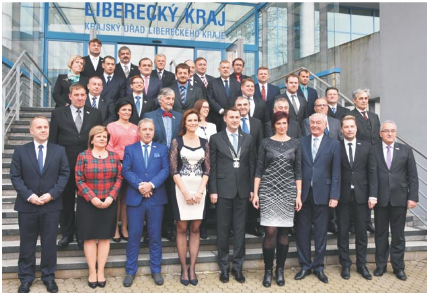
Každá krajská vláda i každá zastupitelská sestava se před nástupem do funkce hromadně fotografuje. Před ustavujícím zasedáním krajského zastupitelstva tak skupinu na schodech krajského mrakodrapu vytvořili úspěšní ve volbách. Pořád ale někdo chyběl. „Tak kdo tu není... Chybí někomu Změna?“ zeptal se kdosi a slyšel hlasitě „Ne“ od těch, co si umí zorganizovat čas a dorazit na první společnou akci včas.