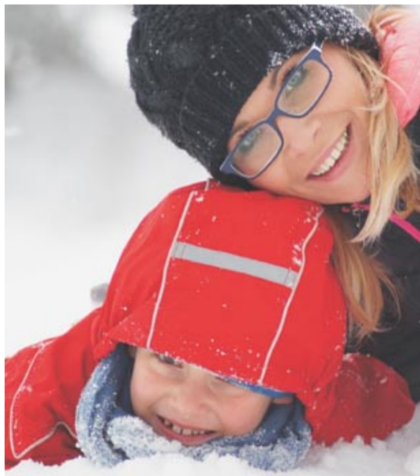
Jizerskohorský Bedřichov se chystá na tradiční nápor turistů...

Původně bylo v plánu zasněžovat i zhruba 2,5 kilometru dlouhou nástupní trasu na magistrálu z Bedřichova na Novou louku. Proti tomu se ale podle starosty postavily Lesy ČR.