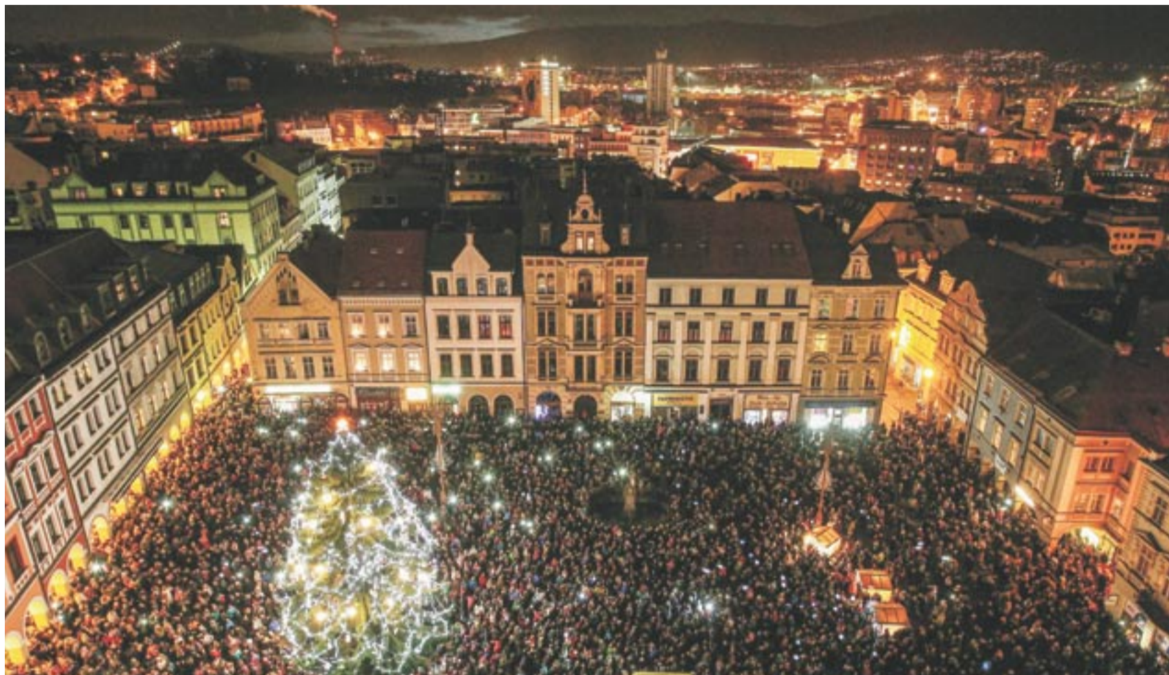
Po celý adventní čas je v centru Liberce připraven perstrý kulturní a společenský program, který může zpříjemnit čekání na Ježíška.